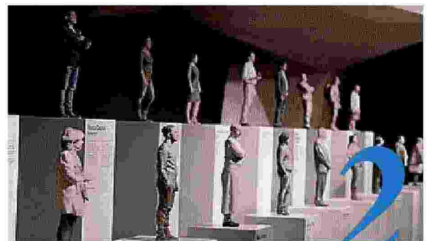
CULTURA La potenza del "saper fare"