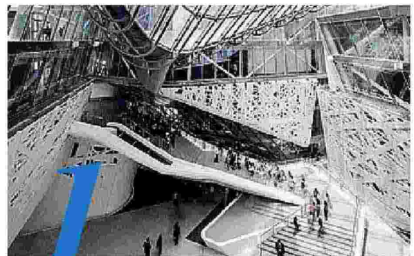
UNICO Palazzo Italia firmato Michele Molè