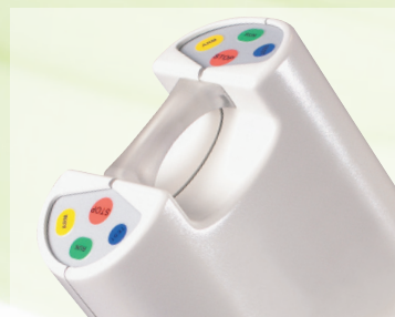
Funzioni semplici e chiare